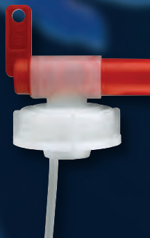
Abfüllhahn 20 Liter Art.-Nr. 33904