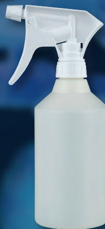
Sprühflasche 500ml Art.-Nr. 33908